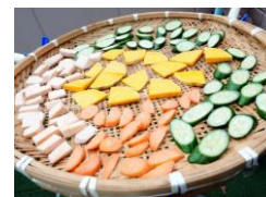
販売についてはお問合せ下さい