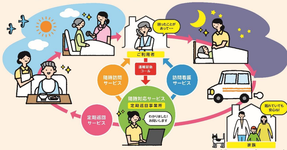
※定期巡回サービスイメージ

「いつも」も、「もしも」も、安心。 住み慣れたお家での暮らしを24時間支えます。