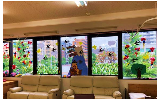
ご利用者様と作成している季節の窓絵