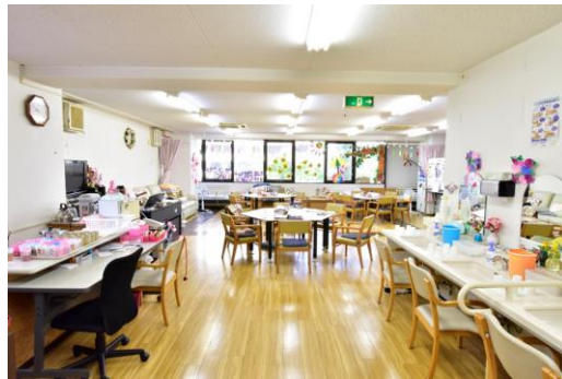
光が差し込む明るいデイフロア