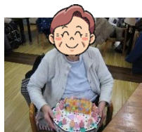
お誕生日のお祝い