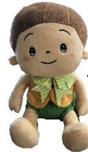
介護ロボット 「かぼちゃん」