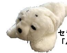
セラピーロボット 「パロちゃん」