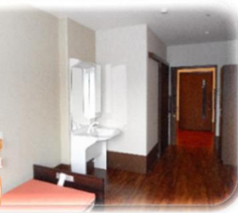
居室には 洗面台・お手洗い・ベット・収納 エアコン・カーテン 完備