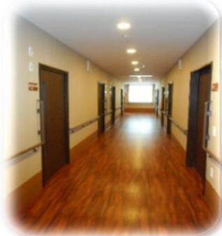
ゆったりとした廊下