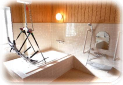
リフト付き浴室（2階）