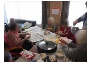
お菓子づくりレク