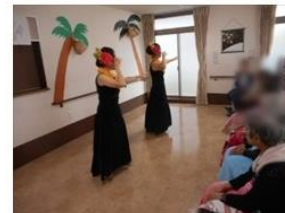
ボランティアさん