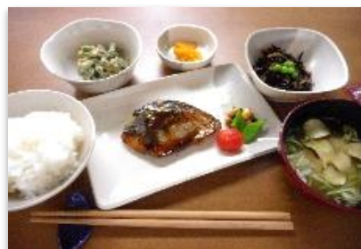
普段のお食事（一例）