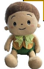
介護ロボット「かぼちゃん」