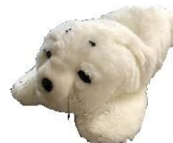
セラピーロボット「パロちゃん」