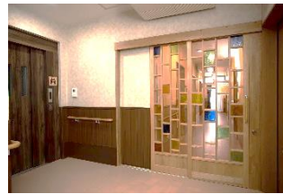
柔らかな光が入るステンドグラス