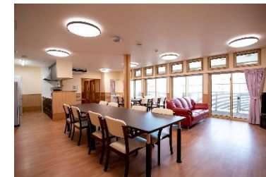
開放感のあるデイルーム（床暖房完備）