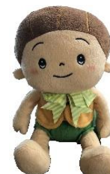
介護ロボット「かぼちゃん」