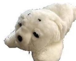
セラピーロボット「パロちゃん」