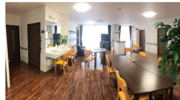
開放感のある食堂・機能訓練室