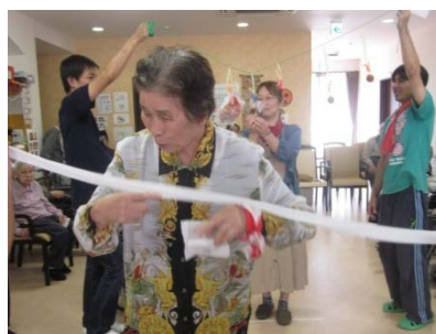
パン食い競争 笑顔ながらも 皆さん真剣に 頑張っていま した