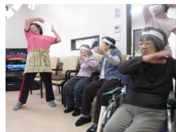
準備運動も しっかりと 行います