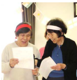
選手宣誓 正々堂々 戦う事を 誓います