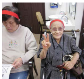
選手の皆様も 気合十分で スタートを 待っています

《運動会》10月18日10:30~14:00 いなばの夢うさぎ 2Fホールにて運動会が開催されました。白熱の紅白戦の様子をご紹介します。