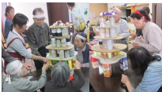
骨抜きタワーゲーム 崩れるまでに抜いた 柱の本数を競います