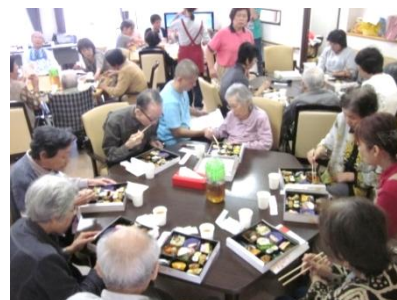
一時休戦して お弁当の時間 沢山食べて 午後からも 頑張ろう