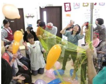
風船乱舞ゲームと玉入れの様子 皆様勝つために一生懸命です