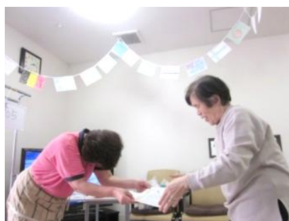
表彰式 白熱した真剣勝負は 紅組の勝利でした。

1Fと2Fの対抗戦となりましたが、合同でイベントを行い、競技や応援をすることで親睦が深まりました。 参加されたご家族様からも「楽しかった」とのお言葉をいただき、よい運動会になったと思います。