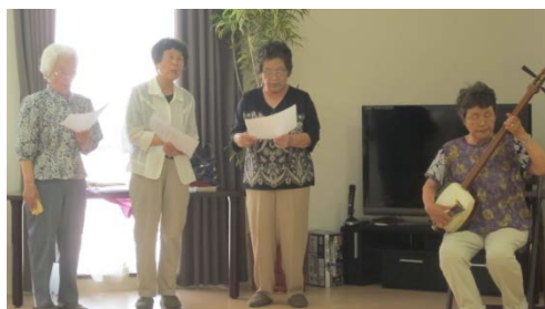
民謡と三味線を披露 してくださいました