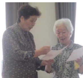
入居者様も歌に 参加されました