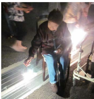
皆様大いに 盛り上がりました