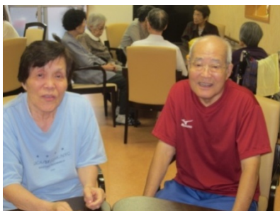
このお二人もおしどり夫婦 です。 いつも仲良しのN夫妻