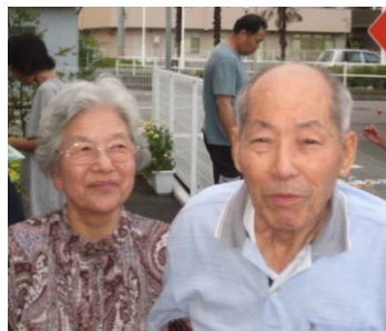
おしどり夫婦 Y夫妻 Y様は奥様に ぞっこんです