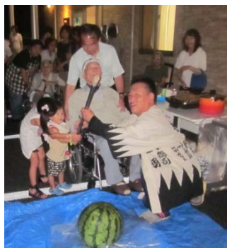
さあスイカ割り 渾身の一撃の 成果は？