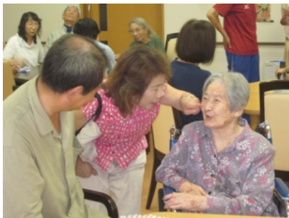
スペースが足りず ご紹介しきれませんが 利用者様もご家族様も 皆様本当に楽しそうに 過ごしておいででした