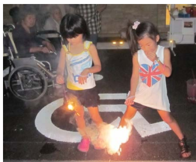
夏祭りの最後は やはり花火です