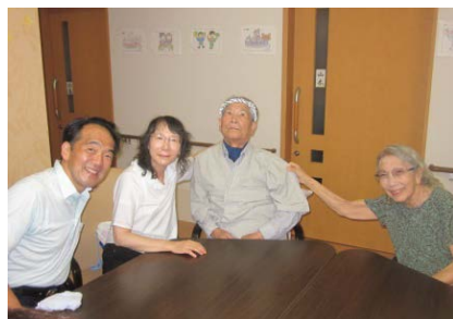
愛情に満ちた ご家族 H様ご一家