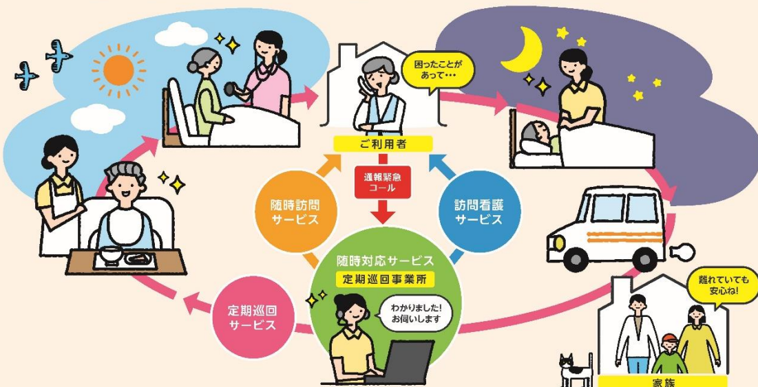
※定期巡回サービスイメージ